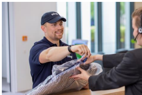
Ding! liefert Produkte und Services von Blumensträußen bis hin zur Textilreinigung direkt an den Arbeitsplatz