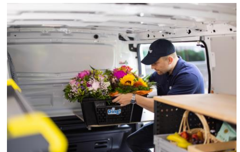
Die Abholung und Auslieferung der Produkte erledigt das Ding! Team mit Elektrofahrzeugen